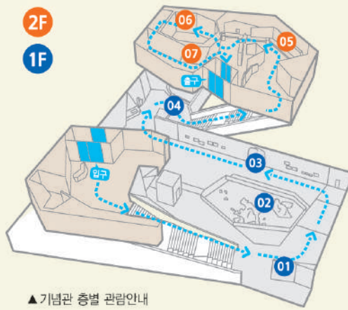
▲ 기념관 층별 관람안내

일본의 독도 불법 침범에 맞서 싸운 독도의용수비대의 3년 8개월간의 기록을 보여주는 공간입니다.