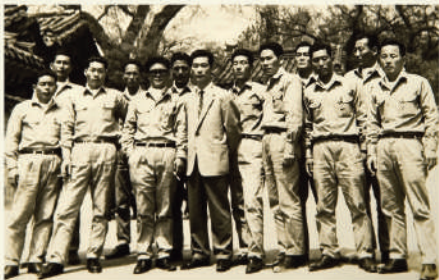
<1966년 훈·포장 수여식 후의 독도의용수비대원>