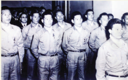
<1966년 훈·포장을 받고 있는 독도의용수비대원>